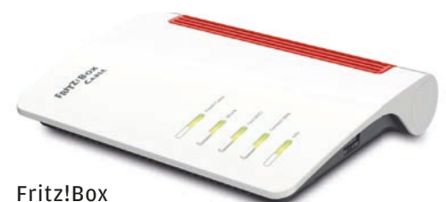
Fritz!Box 6660 cable